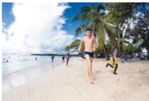
Guadeloupe består av fem större öar som erbjuder många fantastiska sandstränder.

Från Guadeloupe går det båt över till grannön Dominica vilket bara tar två timmar med snabbfärjan.