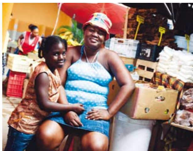
Basse-Terre, huvudorten på Guadeloupe, har en marknad där man verkligen kan uppleva blandningen av kulturer.