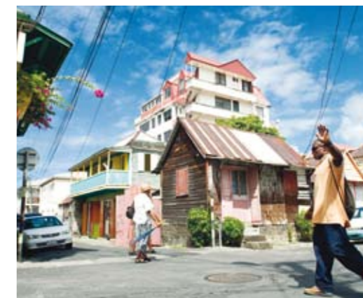
På Dominica råder en lantlig, rustik stämning.

mer vi fram till den ångande sjön som har en stark lukt av svavel. När vinden tillfälligt blåser bort ångan skymtar plötsligt den bubblande sjön fram. På stigen tillbaka genom bergen stannar vi till vid en liten naturlig pool där varmt och kallt vatten blandas till en