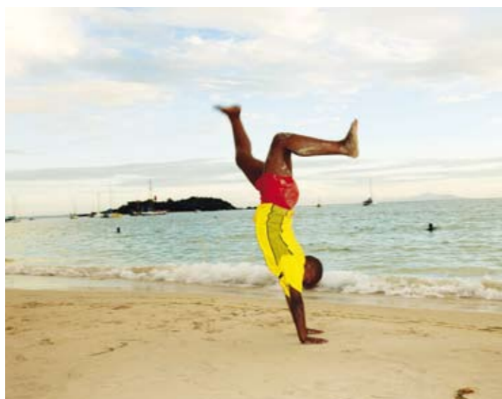
Grande Terre är en av de två största öarna i Guadeloupe. Längs kusten vid Port Louise finns många fina stränder.