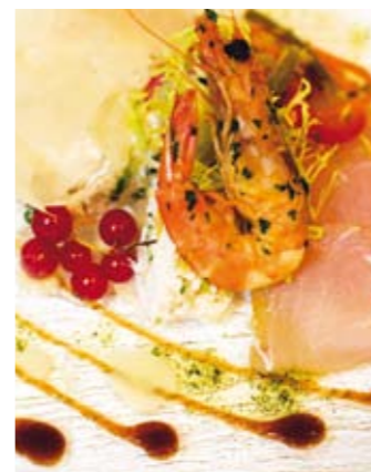
Fransmännen har satt sin prägel på Guadeloupe. Inte minst på maten.

Vid Titou Gorge börjar också vandringen till en kokande vulkansjö som är en av de största i världen. Vår lilla grupp vandrar genom den fuktiga frodiga regnskogen upp till de dimhöjda be-