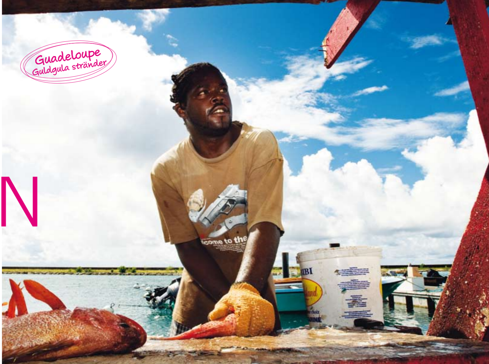
Guadeloupe Guldgula stränder