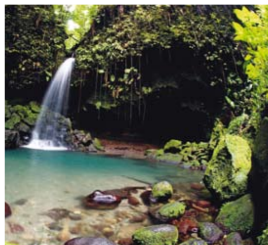
Dominica har rikligt med vattenfall och varma källor. Här finns också 365 floder.